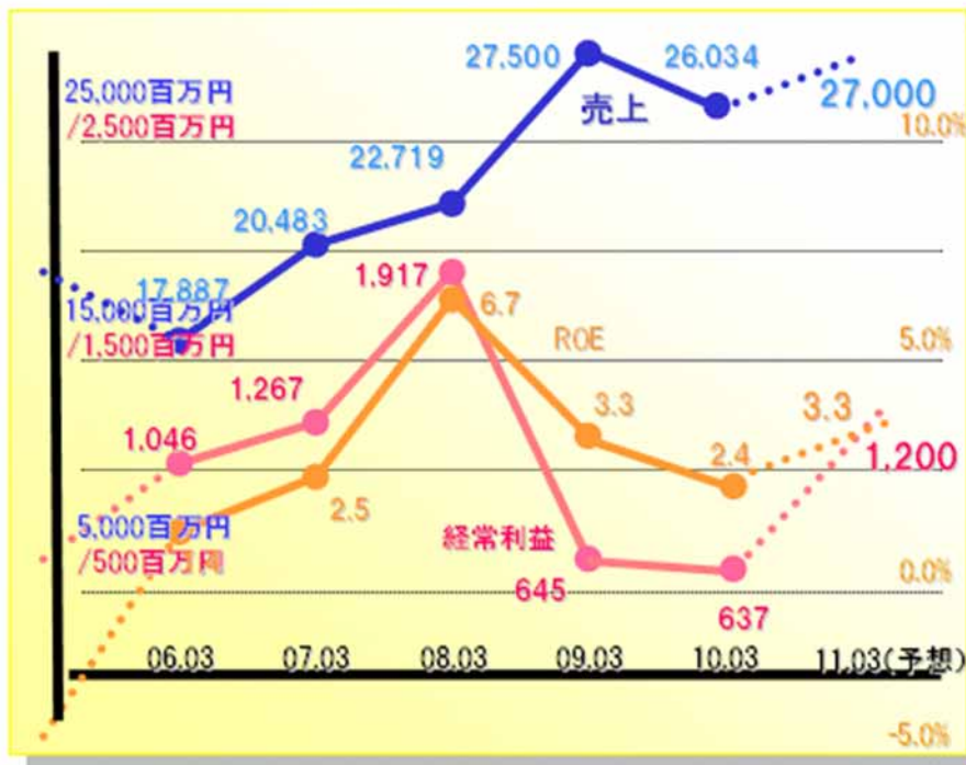
当期及び次期予想を含む目標とする経営指標の5ヵ年推移

当社は、中核事業でありますアミューズメント施設運営事業の「マーケットシェアの拡大・収益性の向上」による市場競争力の確保を重視しており、当面は売上高・経常利益の向上を最優先に目指してまいります。中長期的な経営目標としては株主資本利益率（ROE）10%以上を掲げ、収益性と資本効率を高めて総合的な企業価値の増大を目指します。